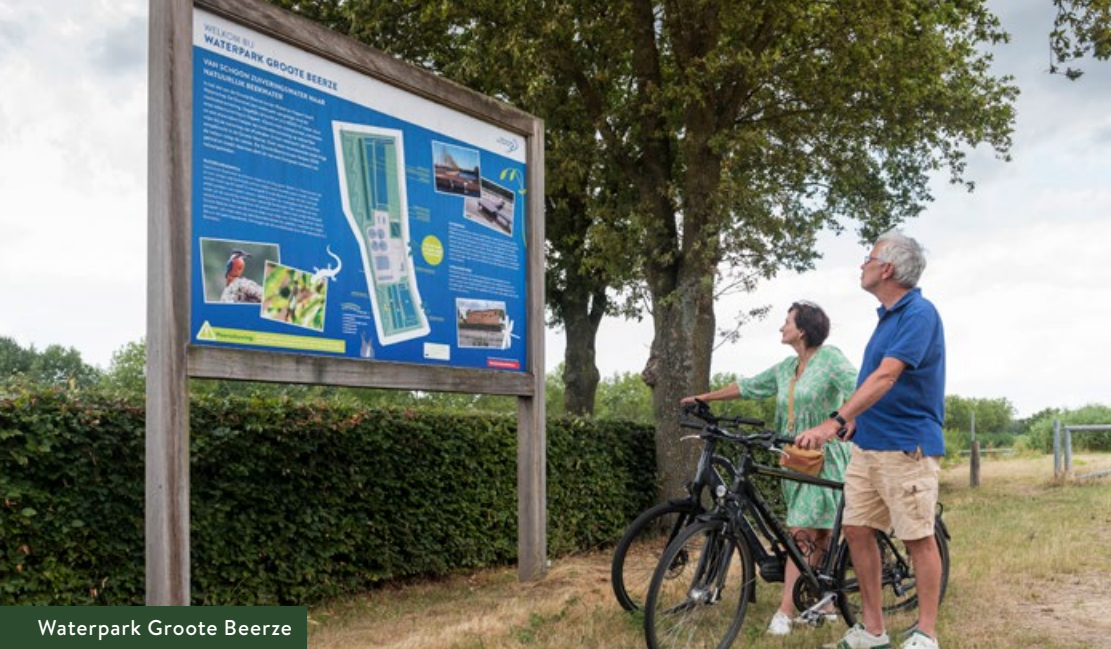
Waterpark Grootte Beerze