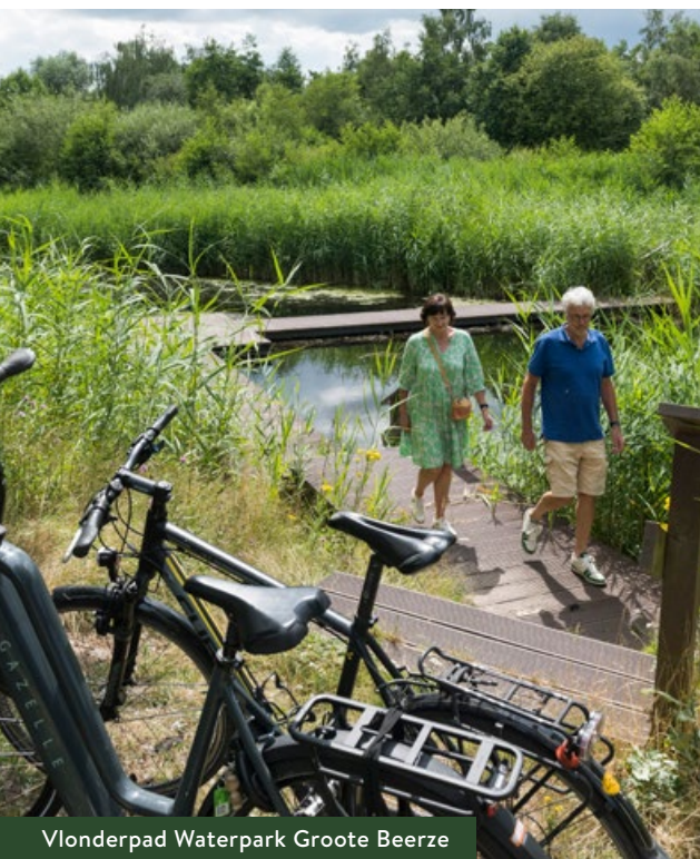
Vlonderpad Waterpark Groote Beerze

Je fietst nu door het beekdal van de Groote Beerze met de beek aan je linkerhand. Toch kun je de beek niet zien liggen. Fiets een klein stukje door op